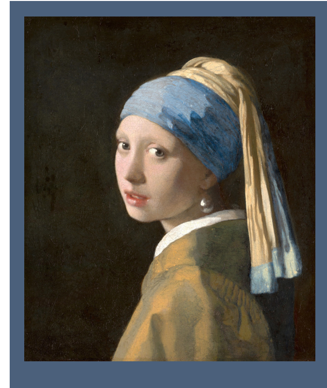
Das Mädchen mit dem Perlenohrring Jan Vermeer van Delft, um 1665, Öl auf Leinwand, 45 x 40 cm